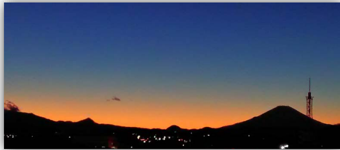
東海大学から見える夕景